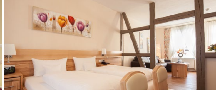
Hotel-Residenz Schwiecheldthaus ★★★★★ S 30 €