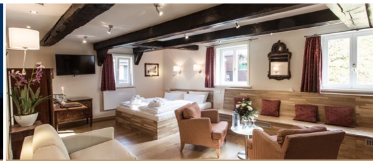
Hotel Alte Münze ★★★★★ 40 €