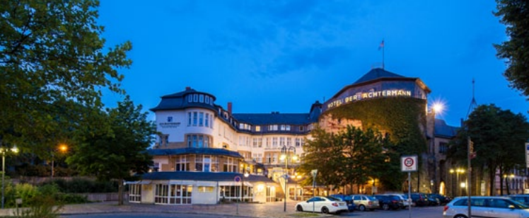
Hotel DER ACHTERMANN ★★★★★ 40 €