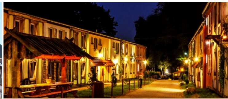
Hotel Harzlodge & Der Fuchsbau 30 €