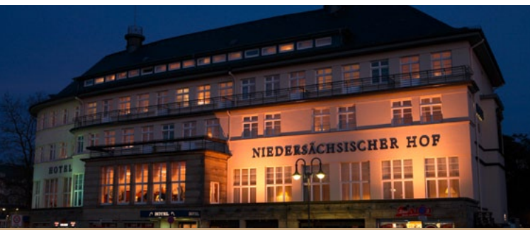
Hotel Niedersächsischer Hof ★★★★★ 40 €

Buchungskontakt: info@hotel-garni-kirchner.de www.hotel-garni-kirchner.de Tel. 05321/34950 Fax 05321/349599