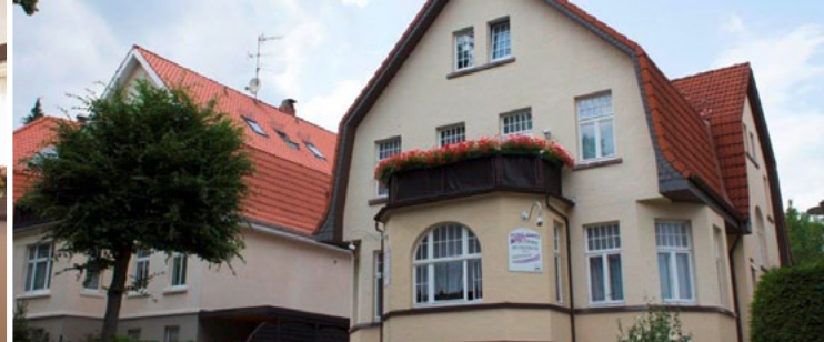
Hotel Garni Kirchner ★★★★★ 30 €