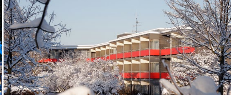
Ramada Hotel Bären ★★★★★ 40 €

Buchungskontakt: empfang@der-achtermann.de www.der-achtermann.de Tel. 05321/7000 0 Fax 05321/7000999