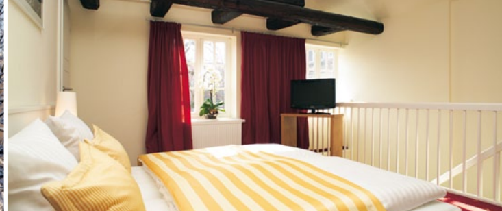
Hotel Schiefer 40 €