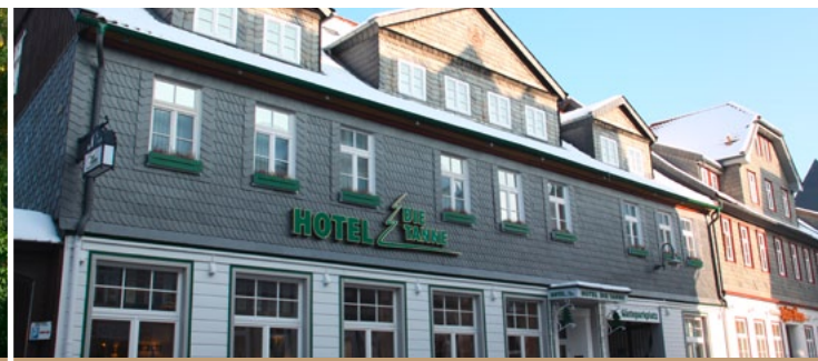
Hotel Die Tanne ★★★★★ 30 €