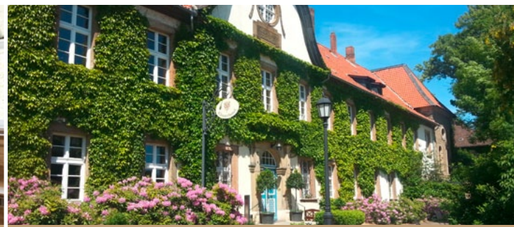
Klosterhotel Wöltingerode ★★★★★ S 30 €